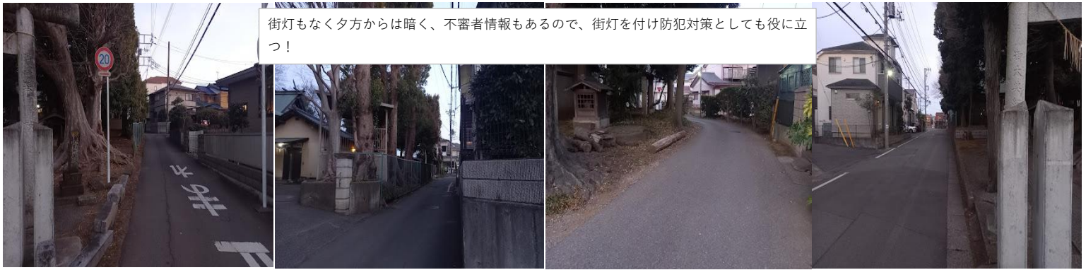
神社の木で死角が多いし、街頭が少なくて暗い。

街灯もなく夕方からは暗く、不審者情報もあるので、街灯を付け防犯対策としても役に立つ！