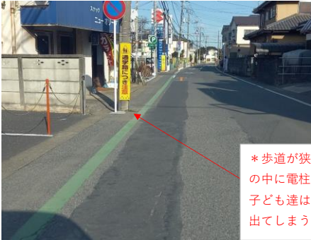
電柱もあるので歩く際、道路に出してしまう。通学路の歩道が狭く車と近くストレス。