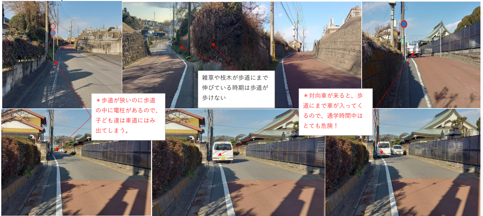
大利根橋からの抜け道の為、車が多く対向車があるとストレスな状況